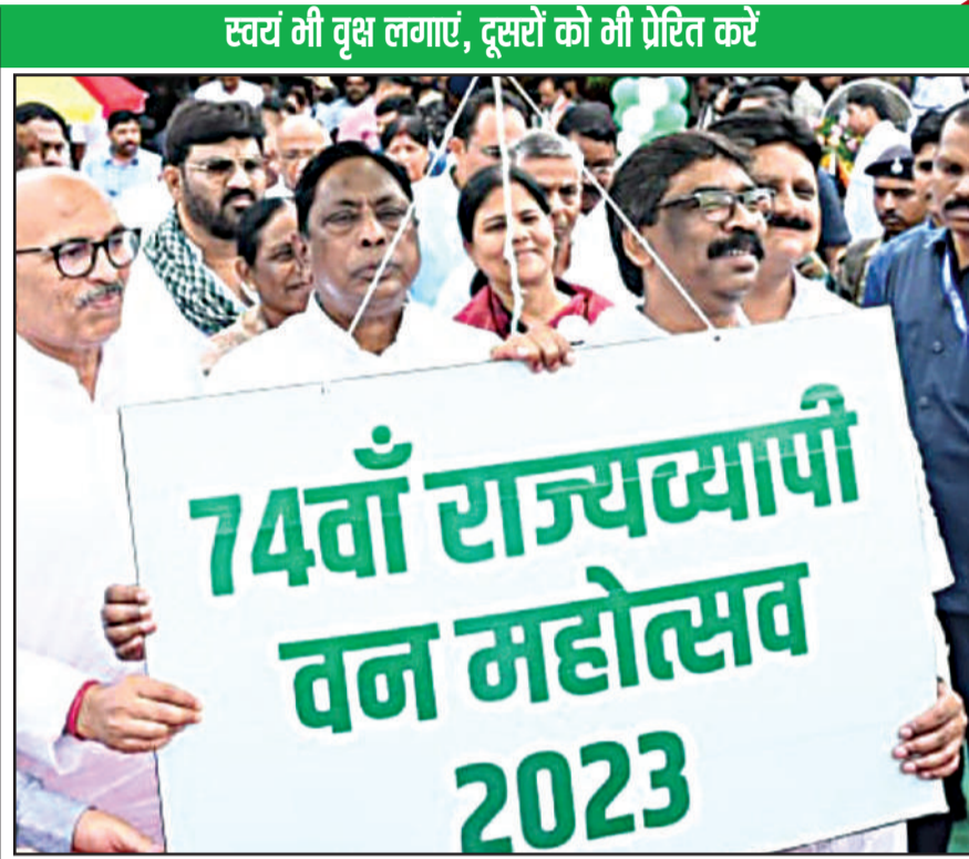
विधानसभा अध्यक्ष के नेतृत्व में झारखंड विधान सभा परिसर में यह वन महोत्सव कार्यक्रम आयोजित हुआ है

प्रभात मंत्र संवाददाता रांची : विधान सभा अध्यक्ष रबीन्द्र नाथ महतो की अध्यक्षता में झारखंड विधान सभा परिसर में 74वाँ राज्यव्यापी वन महोत्सव 2023 कार्यक्रम आयोजित की गई। इस कार्यक्रम में मुख्यमंत्री हेमंत सोरेन ने मुख्य अतिथि सम्मिलित हुए। इस अवसर पर मुख्यमंत्री हेमंत सोरेन ने कहा कि प्रदेश में वन महोत्सव का राज्यव्यापी कार्यक्रम चल रहा है। यह कार्यक्रम राज्य के अलग-अलग जगहों पर निरंतर मनाया जा रहा है। इसी क्रम में हम सभी लोग झारखंड विधान सभा परिसर में पूर्व की भांति इस वर्ष भी वृक्षारोपण कार्यक्रम में उपस्थित हुए हैं। मुख्यमंत्री ने कहा कि वर्तमान समय में जलवायु परिवर्तन को लेकर देश और दुनिया में तेजी से चिंतन और मंथन किया जा रहा है। मुख्यमंत्री ने कहा कि कहीं न कहीं प्राकृतिक व्यवस्थाओं के साथ बड़े पैमाने पर छेड़-छाड़ किया जाना अथवा दोहन होना जलवायु परिवर्तन का मूल कारण है। बढ़ती हुई क्लाइमेट चेंज से मानव जीवन हो, वन्य प्राणी हो, जल प्राणी हो, चाहे इस पृथ्वी पर पाए जाने वाले अन्य प्राणी हो, सभी प्रभावित होते हैं।