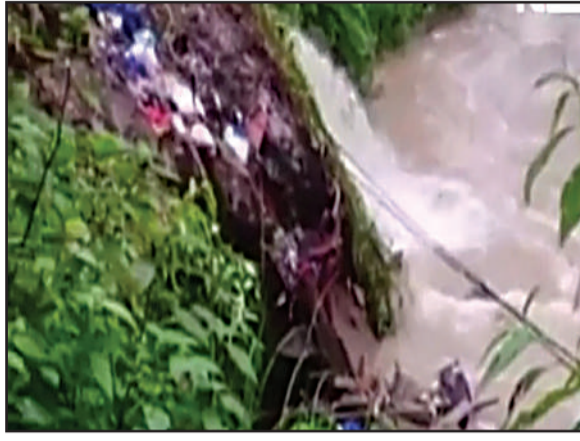
जानकारी दी जा रही है, उसमें बढकर 19 हो गई है। जो दुकानों लापता लोगों की संख्या 13 से होटल ध्वस्त हुए हैं। उनका मलबा

एजेंसी देहरादून : उत्तराखंड के गौरीकुंड में भारी भूस्खलन से 19 लोगों के लापता होने की सूचना है। साथ ही केदारनाथ यात्रा को भी रोक दिया गया है। गुरुवार देर रात 12 बजे के आस-पास केदारनाथ के मुख्य पड़ाव गौरीकुंड डट पुलिया के पास हुई लैंडस्लाइड के कारण 3 से 4 दुकानों के ऊपर पहाड़ी से आए मलबे के कारण अबतक 19 लोग लापता बताए जा रहे हैं। जिलाधिकारी और पुलिस अधीक्षक मौके पर हालत का जायजा लेने पहुंच चुके हैं। वहीं, आपदा प्रबंधन ने नया अपडेट देते हुए बताया है कि लोगों द्वारा जो