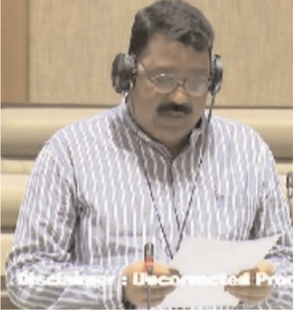
नियुक्ति में पद सृजित कर शिक्षक नियुक्ति की प्रक्रिया शुरू किया जाए एवं विश्वविद्यालय के