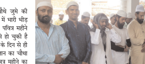
मोहल्ल, बड़कागांव चट्टी, महदी, चेपा खुर्द, डाडी, सिंदुवारी, नगड़ी, महुगाई, अलगड़िहा, हाह, नापो, चंदौल, सहित अन्य गांवों में बड़ी संख्या में मुस्लिम समुदाय के लोगों को मौलानाओं ने जुमे की नमाज मस्जिदों में अदा कराई। जुमे के नमाज से पहले इमाम साहब ने जकात और फितरा के बारे में नमाजियों को विस्तार पूर्वक जानकारी दी। इमाम साहब ने लोगों को समझाया के जैसे हम ईद में खुशी मनाते हैं नए कपड़े पहनते हैं वैसे ही जकात और फितरा अदा कर के जो समाज के गरीब तबके के लोग हैं उनका भी मदद करें ताकि वो भी ईद की खुशी मना सकें।