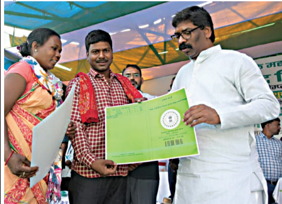
मुख्यमंत्री हेमंत सोरेन ने साहेबगंज में सिदो कान्हू कृषि एवं वन उपज संघ के तहत पैक्स-लैम्स के लिए सदस्यता महाअभियान का शुभारम्भ किया। इस अवसर पर उन्होंने साहेबगंज जिले को 2080 योजनाओं की सौगात दी और लाभुकों को सशक्त बनाने के लिए उनके बीच परिसंपत्तियों का वितरण किया।

सदस्यता महाअभियान शुरू हो रहा है। आप सभी इससे जुड़े। इसके बाद आपके उत्पादों को पैक्स-लैम्स खरीदेगी। इससे आपके उत्पादों को उचित मूल्य और बाजार मिलेगा। मुख्यमंत्री ने यह भी कहा कि पलाश ब्रांड के जरिए महिला स्वयं सहायता समूह के उत्पादों को बाजार उपलब्ध कराने का काम किया जा रहा है।