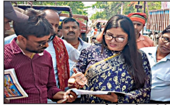
फ्लाईओवर विमेंस कॉलेज मार्ग में बनाकर मुख्य फ्लाईओवर मैं जोड़ देने से शहर के अंदर गढवा जाने वाली गार्डियाँ से हो रहे जाम से निजात मिल सकता है। यह दोनों योजना निगम बोर्ड द्वारा पारित है और शहर के लिए अति महत्वपूर्ण भी है।

प्रभात मंत्र संवाददाता मेदिनीनगर: अरुणा शंकर ने कहा कि 20 तारीख को होने वाली जिला स्तरीय दिशा की बैठक में शहर के गिरेते जलस्तर बनाए रखने के लिए कोयल नदी में शहर के बाहर मिनी बांध 5 फीट नीचे से 5 फीट ऊपर तक बांधने की योजना जिसे मैंने निगम बोर्ड द्वारा पारित कराया है। योजना रखूंगी ताकि शहर का जल स्तर में सुधार हो सके और नित्य बंद हो रहे चांपा नल में पानी आ सके। क्योंकि यहाँ एकमात्र विकल्प जनजीवन को जल देने का है। साथ में कोयल में 5 फीट पानी बने रहने से जानवरों को भी सुलभ हो पाएगा तथा सिंचाई भी यथासंभव होगी। महापौर ने कहा कम लागत में मिनी