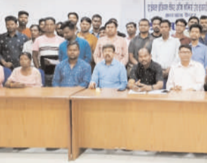
2011 में प्रथम बार टाटा ग्रुप द्वारा इस योजना को अपने प्रतिष्ठानों में लागू कराया। जिसमें कुछ आदिवासियों को बिजनेस व्यापार से जोड़ा गया था एवं अन्य को टाटा ग्रुप से जोड़ना था परंतु वर्ष 2011 के बाद एफमेंटिव एक्शन योजना को केवल अखबार में प्रदर्शित किया गया और भाषा संस्कृति संबंधित कार्यक्रमों से उधमिता को गायब हो कर दिया गया। मात्र दो-चार आदिवासी वेंडर्स को छोड़कर बाकी सभी वेंडर्स को इंझायरी तक नहीं दी जाती है। उन्होंने आरोप लगाया कि, टाटा ग्रुप के कुछ अधिकारियों द्वारा भी आदिवासी