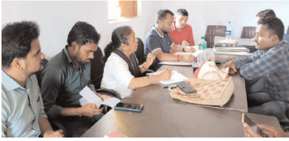
योजना (सिचाई कूप,डोभा) का कार्य कर दिया गया है। लेकिन उक्त स्थल पर योजना दो छई किलोमीटर तक