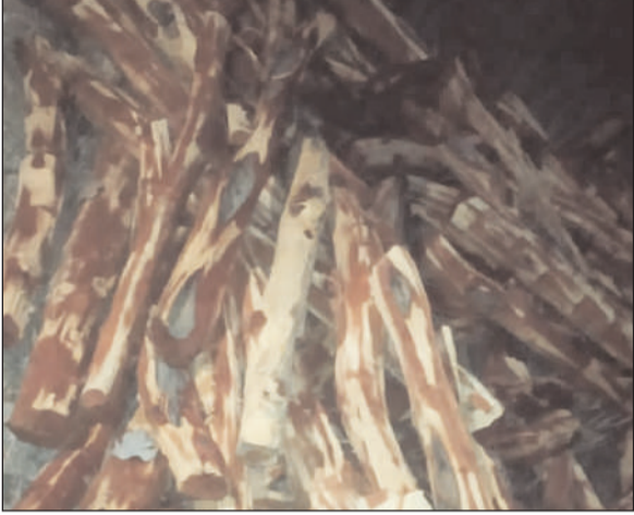
छपाकर परिवहन की तैयारी की जा रही थी इस दौरान वन विभाग की टीम को अपनी ओर आता देख