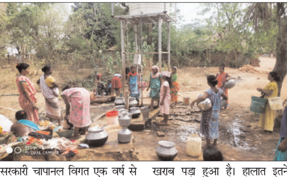
सरकारी चापानल विगत एक वर्ष से खराब पड़ा हुआ है। हालात इतने

प्रभात मंत्र संवाददाता पाकुड़िया : प्रखंड का राजबाड़ी गितिल टोला और राय पाड़ा बिचपहाड़ी गांव इन दिनों भीषण जलसंकट के दौर से गुजर रहा है। जहां रायपाड़ा बिचपहाड़ी की आबादी लगभग 200 लोगों की है। लेकिन वहां शुद्ध जलापूर्ति हेतु लगा ओवेरहेड सोलर पानी टंकी विगत तीन माह से साधारण मरम्मती के अभाव में बंद पड़ा हुआ है। वहीं राय टोला में