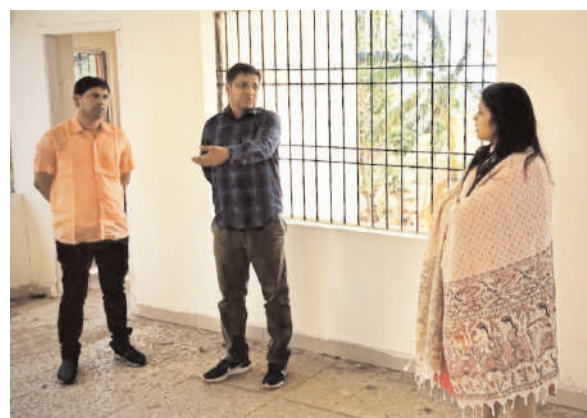
विकास पदाधिकारी गोला, अंचल अधिकारी गोला सहित अन्य