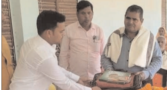
प्रभात मंत्र संवाददाता

पुरुष के नाम से जाने जाते हमारे नेता आदरणीय रघुवर दास जी ने अपने कार्यकाल में गढ़वा जिला के लिए अनेकों विकास उन मुख्य कार्य को गतिमान किया है भगोड़ी सुपर पावर ग्रिड, सड़क शिक्षा इत्यादि सभी महत्वपूर्ण कार्यों को अपने कार्यकाल में गतिमान किया है श्री बंशीधर नगर आगमन पर हम तहे दिल से उनका हार्दिक स्वागत और अभिनंदन करते हैं।