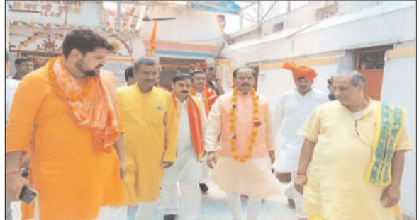
प्रभात मंत्र संवाददाता

बंशीधर मंदिर में राधा एवं भगवान कृष्ण की बहुत ही प्राचीन मंदिर है। मैं जब भी गढ़वा आता हूँ तो भगवान बंशीधर जी का दर्शन करने जरूर आता हूँ। उन्होंने कहा कि दर्शन पूजन करने से भगवान ने मुझे बहुत कुछ दिया है। मैं राज्य की जनता खासकर गरीब किसान के घर परिवार में सुख शांति एवं समृद्धि आये इसके लिये मैं बंशीधर जी से प्रार्थना करता हूँ। साथ ही राज्य में जो विनाशकारी शक्ति है उसका भगवान कंस की तरह विनाश करें। इसके पूर्व पूर्व सीएम श्री दास के बंशीधर मंदिर पहुंचने पर भाजपा महिला मोर्चा की नेताओं ने उन्हें बुके देकर स्वागत किया एवं उन पर पुष्प वर्षा की।